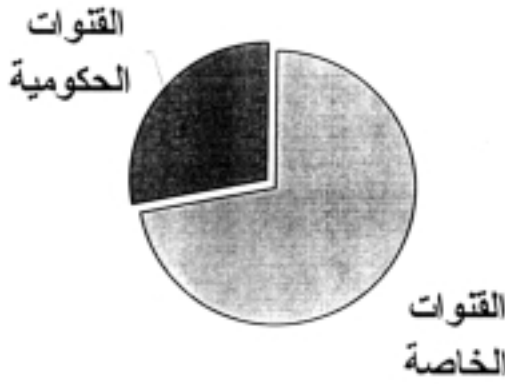
رسم بياني 2 : القنوات الحكومية والقنوات الخاصة

وإذا تأملنا في توزيع القنوات حسب جنسية صاحب رأس المال إن كانت القناة خاصة أو البد الباث إن كانت القناة حكومية نجد أن أربعة أقطار عربية دون غيرها تستأثر بنصيب الأسد من عدد القنوات المتخصصة وهي :