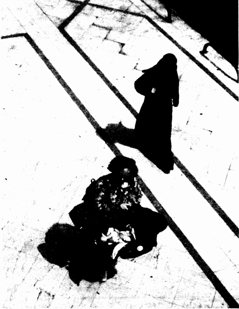
امراتان فى شارع جامعة الدول العربية

وقد كانت مواصفات الزوجة المثالية المنتمية للطبقة المتوسطة العليا موضع مناقشات ساخنة. فمع انتشار أساليب الحياة الكوزموبوليتانية الصارخة بين نساء الطبقة المتوسطة العليا فى سن الزواج فإن أشكالاً من التدين والحشمة ذات الطابع الطبقي كانت مصدراً لنماذج مجندرة مختلفة وإن تميزت بقدر مماثل من الجاذبية