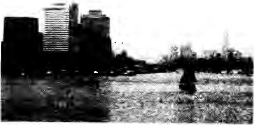
صورة القاهرة على ضفاف النيل