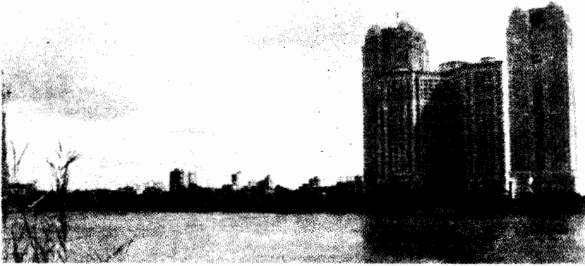
أبراج نايل سیتی

هذه التماثلات فى المشاهد الحضرية حول العالم تفصح عن نشوء دائرة من الفضاءات العولية المترابطة والموجودة داخل محيط غالباً ما يكون مدقعاً ويتزايد تهميشه. وتدفع ساسكيا ساسن (٢٠٠٠ - ٢٠٠١) بأن المدن اكتسبت أهميتها باعتبارها مفاصل التنسيق والسيطرة للإنتاج العولى المنتشر. فهى تؤوى تجسيدات العولة التى يتزايد انفصالها عن بقية المشهد الحضرى. وهذه المركزية (المتصورة) للمدن خلقت ديناميتها الخاصة. ويدفع روبنسون بأن " المدينة العولية " قد ترجمت إلى " خرافة تنظيمية " تعد بثورة حضرية جديدة، وتهدد بانفصال شامل (٢٠٠٢، م ب سميث ٢٠٠١) ويدفع نيل سميث بأن تركيز الإنتاج على الصعيد المتروبولى (Metropolitan) المتصل بالعاصمة أو الخاص بها) نشأت عنه حضرية جديدة (٢٠٠٢: ٤٣٤).