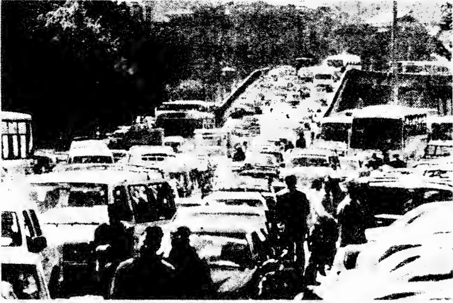
كوبرى (جسر) شارع رمسيس العلوى

وقد استكملت الخطة الرئيسية للبنية التحتية لتحسين المرور داخل القاهرة. ويوصل طريق دائرى وطرق سريعة داخل المدينة مدينة السادس من أكتوبر، الموقع الرئيسى للمشروعات الاقتصادية اللافتة الجديدة مثل مدينة الإنتاج الإعلامى ومجمع الاتصالات الدولية، بمختلف أجزاء القاهرة، على تباعدها. هذه البنية التحتية تصادف أنها تصل مناطق تجارية قاهرية راقية مختلفة، وهو ما أدى إلى زيادة سرعة الحركة بين هذه المناطق المتباعدة، وبينها المدن والمجمعات السكنية الجديدة فى الصحراء (انظر خريطة القاهرة). ورغم أن هذه الكبارى العلوية والطرق السريعة فعلت الكثير لتحسين حالة المرور التى كانت سيئة السمعة، فيما مضى، فإنها خلقت أيضاً شروطاً