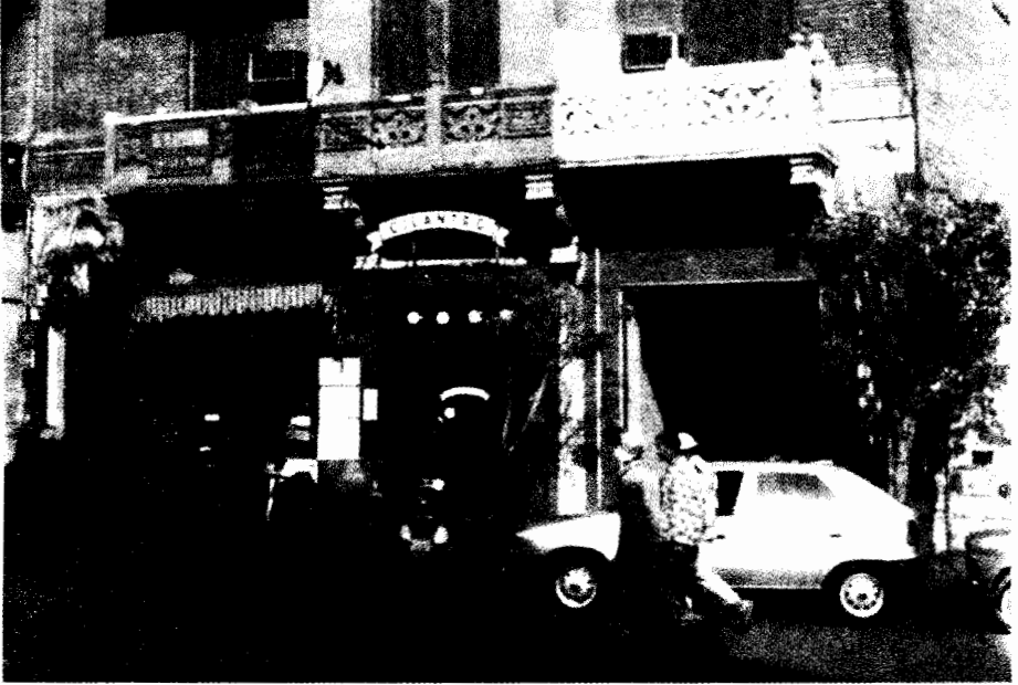
مقهى سيلانثرو بوسط القاهرة

الطبقة المتوسطة العليا لجهة الأسلوب ويعتبرون من " مستوى اجتماعي " أدنى. وقد يكون اللفظ الأقدر على توضيح مغزى هذا المصطلح هو " سوقى ". ويعكس شعبي أو بلدى فإن مصطلح " بيئة " لا يشير إلى الطبقات الأدنى أو إلى ما يفترض أنه عاداتهم بل إلى طبقة متوسطة " فاشلة " (٤٤). ويعكس الانتقال من بلدى إلى بيئة انتقال الصراع الرمزي من موقع على الحدود بين " الطبقة المتوسطة المتعلمة " و " الطبقات الدنيا الفظة " إلى خطوط التقسيم داخل الطبقة المتوسطة ذاتها. فقد حلت تقسيمات أكثر مراوغة محل التمييزات الجلية والواثقة التي تقوم على ارتباط بين الطبقة والثقافة التي تنطوي عليها ثنائية " بلدى " ونقيضه " شيك " أو " مستوى "، ضمن زخم عالى التوتر من الأذواق والأساليب.