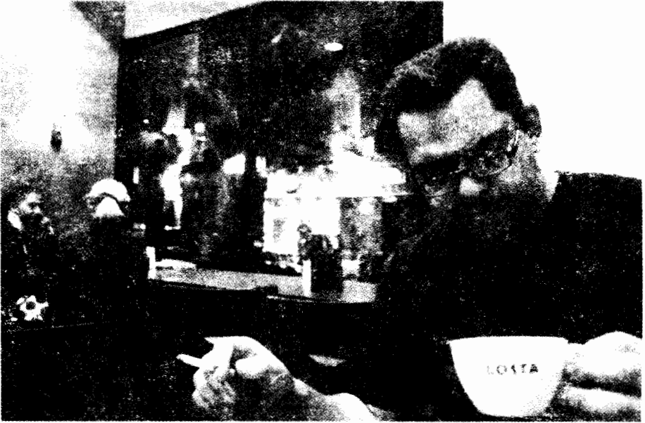
مقهى كوستا، بالزمالك

من غير صوت، وقدمت أغنيات شعبية عربية وغربية رائجة خلفية موسيقية بديلة. ومعظم زياراتي لمقهى سبكترا كان في أوقات النهار أو في بواكير المساء لأقابل واحدة من صديقاتي أو معارفي. ورغم اتساع المقهى، فلطالما تعين علينا أن ننتظر بالخارج حتى تخلو إحدى الطاولات. كنا نختار طاولة في مقدمة المقهى ونطلب سلطة أو ساندويتش. وقد اشتهر سبكترا بأنه يقدم طعاماً طيباً ورخيصاً نسبياً. وكانت قائمة الطعام تتألف من تشكيلة واسعة من البيرغر والسلطات والساندويتشات بما في ذلك سلطة سيزار وكلوب ساندويتش اللذان يكاد لا يخلو منهما مكان كهذا. وفي الأمسيات كانت الغرفة الخلفية تكتظ بزحام من شباب أصغر سنّاً جاء بالأساس للتفاعل الاجتماعي في شغل مختلطة الجندر.