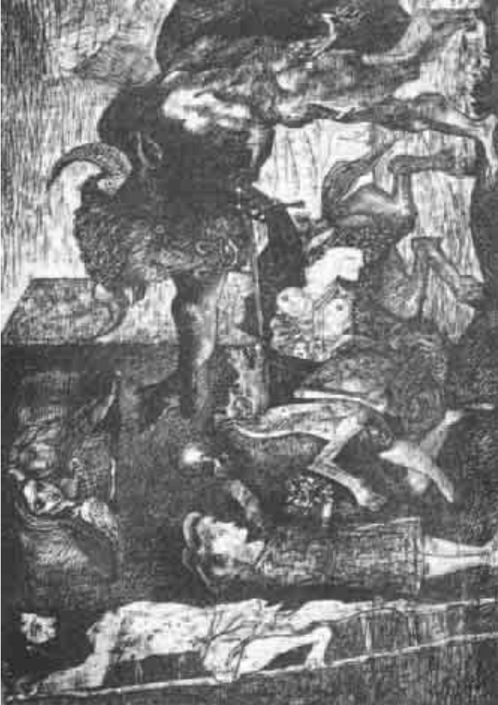
ظهور المينوتور في لوحات بيكاسو قبل الجورنيكا