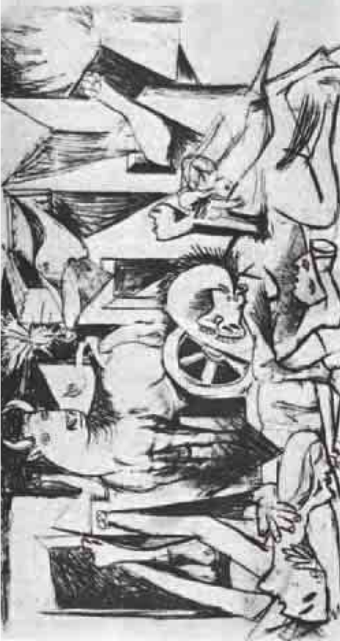
الجورنيكا في المرحلة الثالثة (9 مايو 1937)