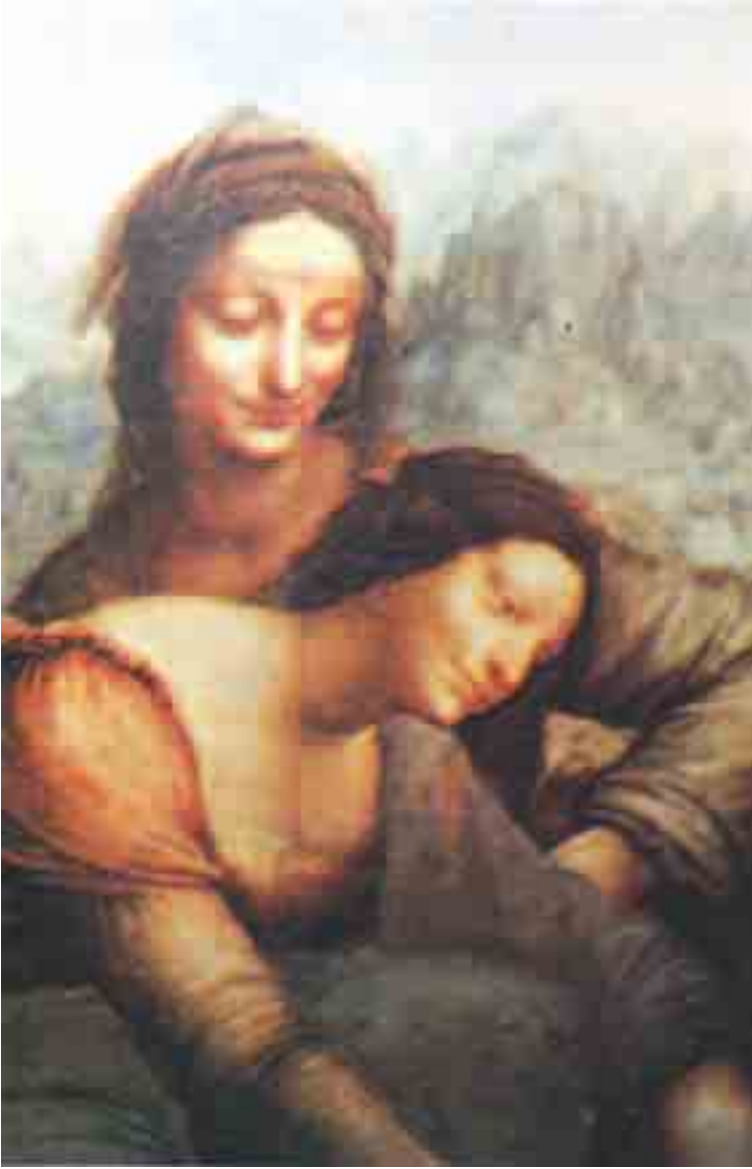
القديسة آن والعذراء والطفل