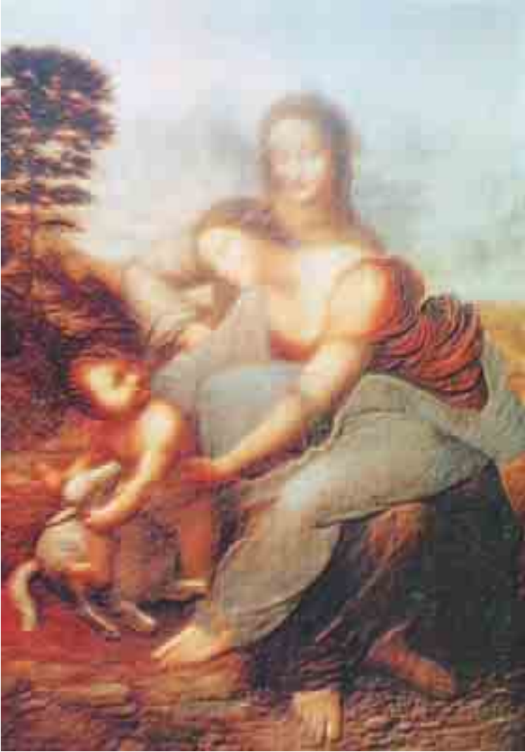
تفصيل من لوحة: القديسة آن والعذراء والطفل