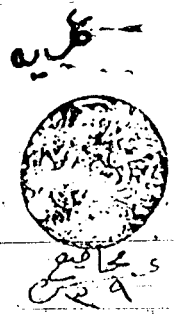
صورة عن غلاف المخطوطة