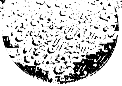
ظهر الورقة الأخيرة من نسخة الأصل ويرى فيها ختم وقفية مكتبة أحمد عارف حكمة

بِسْمِ اللَّهِ الرَّحْمَنِ الرَّحِيمِ بِإِذْنِ اللَّهِ جُوذُوهُ أَبُو بَكْرٍ سَلَّمَ وَوَهَّابِيٍّ وَاللَّيْلِيُّ إِعْتَقَ لِسْمَ أَدْعُوكَ رَبِّ تَعَزَّاهُ تَعَزَّاهُ فَأَدَارُهُ مَعَهُ بِرُوحِ الْبَيْتِ قَدْ قَادُوا أَمَلَ إِلَيْكَ وَذِي جُوذُوهُ عَالِمٌ وَاللَّيْلِيُّ وَاللَّيْلِيُّ وَعَلِمْتُ أَنَّكَ لَا تَحِبُّ أَبَا بَكْرٍ سَلَّمَ وَوَهَّابِيٍّ وَاللَّيْلِيُّ بِسُورِ رَجَبِكَ لَوْلَا نِيَّاهُ وَاللَّيْلِيُّ وَاللَّيْلِيُّ وَاللَّيْلِيُّ فَسَخَّرَ مِنْ تَعَزَّاهُ تَعَزَّاهُ تَعَزَّاهُ تَعَزَّاهُ تَعَزَّاهُ دِينَهُ الرَّابِعِيَّ عَامَ جِيئَهُ بِرُوحِ الْبَيْتِ وَاللَّيْلِيُّ وَاللَّيْلِيُّ وَاللَّيْلِيُّ وَلَطْفَهُ وَبِرَّانَهُ وَأَبْرَارَهُ وَاللَّيْلِيُّ وَاللَّيْلِيُّ مَا فِي حَيْدِ الْبَيْتِ عَشْرَةَ أَرْبَعَةَ عَشَرَ الْخُرَيْسِيُّ جُوذُوهُ وَاللَّيْلِيُّ وَاللَّيْلِيُّ