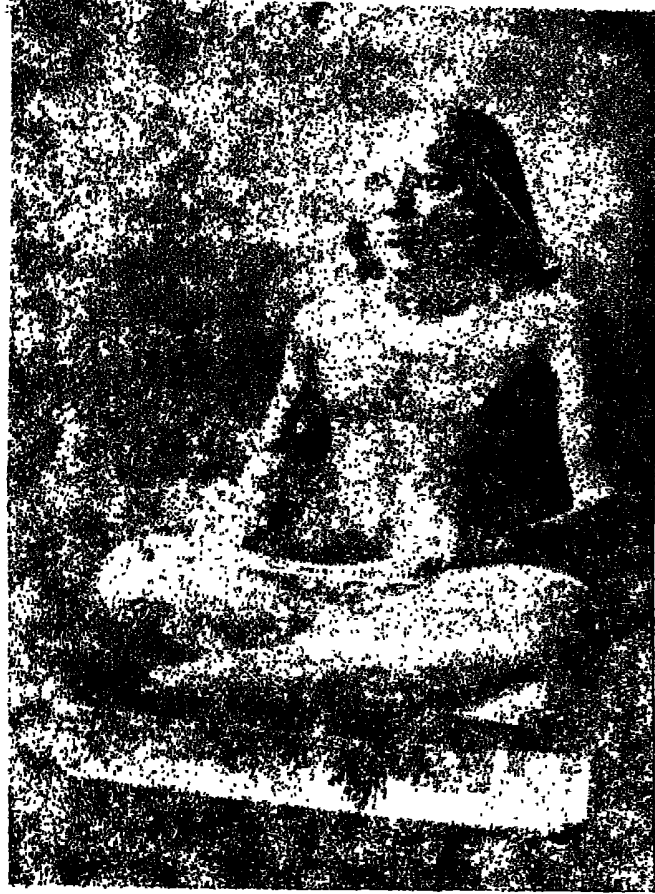
تمثال يدبغ من الحجر الجيري الملون يمثل كاتباً متريعا ، وعلى ركبتيه ملف منشور . من البردي - سقارة ، الأسرة (٤) . ( محفوظة بالمتحف المصرى )