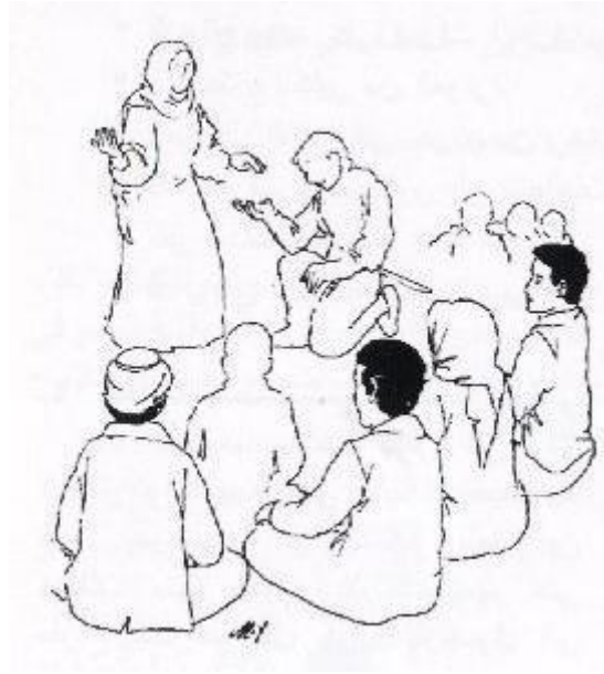
شكل (1) : آلية تنفيذ استراتيجية لعب الأدوار