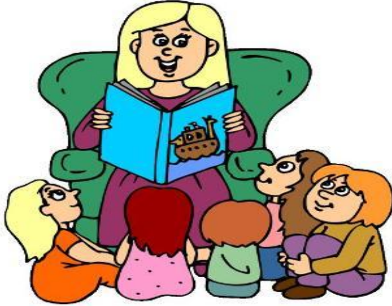
شكل (2) : آلية تنفيذ استراتيجية السرد القصصي

-وأخيراً تعرف قصص الأطفال " بأنها فن أدبي نثري، يعالج موضوعاً أو هدفاً معيناً، ويتكون من شخصيات ومكان وزمان وصراع وعقدة وحل، يقدم للأطفال بشكل ممتع وشيق وجذاب". (أبو رحية، 2013: 48) من خلال التعريفات السابقة تستنبط الباحثة تعريفاً للسرد القصصي بأنه " هو نشاط فني تعليمي تعليمي، يهدف إلى تقديم المادة العلمية للمتعلمين بطريقة مشوقة، يتم فيها سرد مجموعة من الأحداث المتسلسلة والمتراصة من خلال شخصيات ومواقف تترايط فيما بينها، وذلك لتحقيق الأهداف التعليمية التي ينشدها المعلم. والشكل رقم (2) يعبر عن آلية تنفيذ استراتيجية السرد القصصي